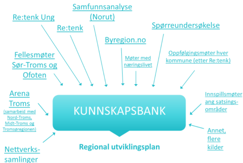
Fig.1 Kunnskapsbank – kunnskapsinnhenting for Sør-Troms

Plansjen nedenfor oppsummerer kildevalgene i prosjektet: